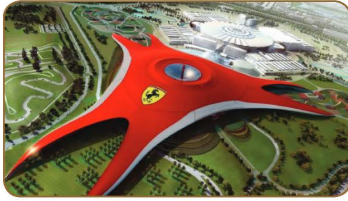
عالم فيراري في ابوظبي